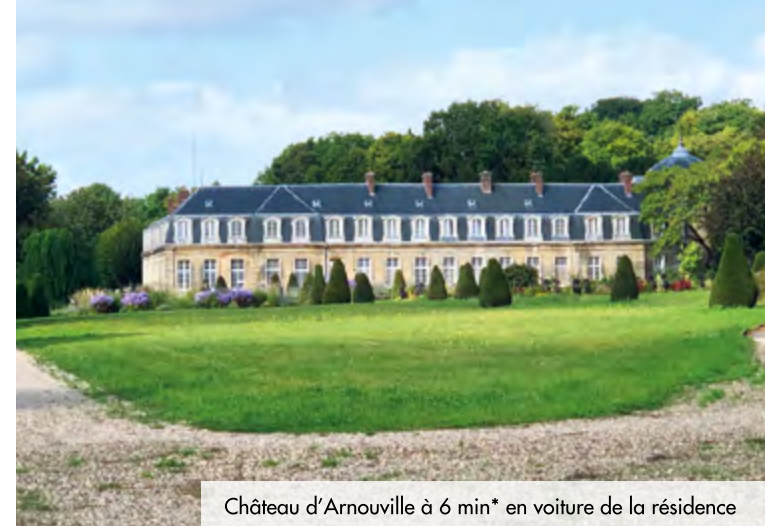
Château d'Arnouville à 6 min* en voiture de la résidence

Au sein de la communauté d'agglomération de Roissy Pays de France, Arnouville est située à l'extrême sud-est du Val-d'Oise, à 19 km* du centre de Paris et à 14 km* de la Porte de la Chapelle. Principalement résidentielle, la ville offre un cadre de vie paisible, idéal pour les familles. Dans un environnement fleuri, elle compte trois monuments historiques, dont un château du XVIII e , et propose de nombreuses activités culturelles et sportives au travers d'une quarantaine d'associations.