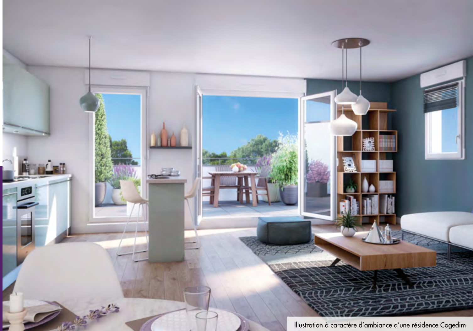
Illustration à caractère d'ambiance d'une résidence Cogedim