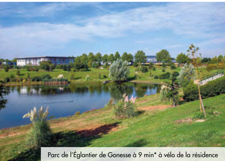
Parc de l'Églantier de Gonesse à 9 min* à vélo de la résidence