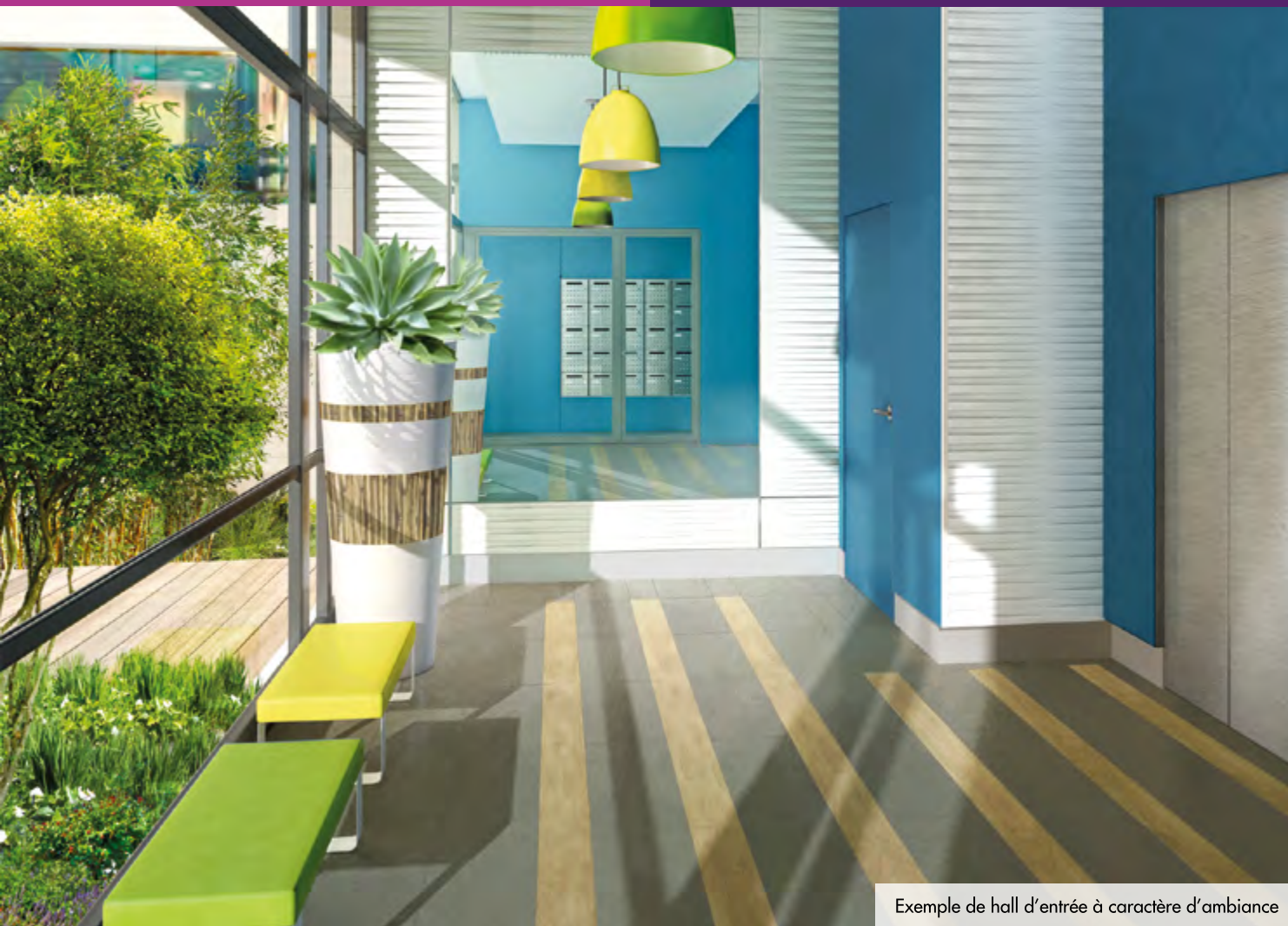
Exemple de hall d'entrée à caractère d'ambiance